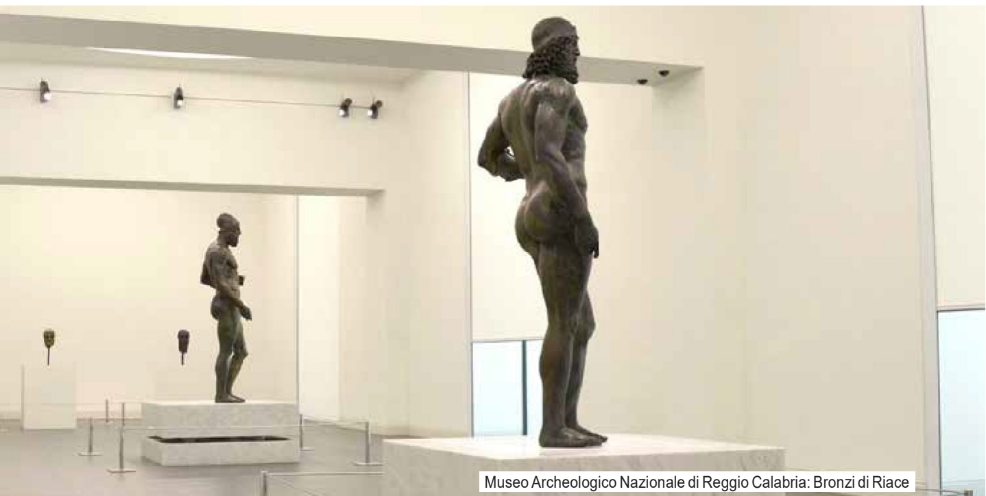
Museo Archeologico Nazionale di Reggio Calabria: Bronzi di Riace

Prima colazione in hotel. Al mattino partenza per Reggio Calabria . All'arrivo visita del Museo Archeologico dove sono custoditi i Bronzi di Riace , due splendide statue di guerrieri risalenti al V secolo a.C. rinvenuti nel mare antistante Riace nel 1972. Il museo, ristrutturato e riaperto recentemente, oltre ai Bronzi contiene altri pregevoli reperti come i Dioscuri, il Kouros e i Bronzi di Porticello. Pranzo